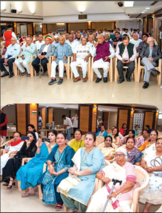
દેશ ભક્તિના ગીતોનો આસ્વાદ માણતા ઉપસ્થિત સભ્યો