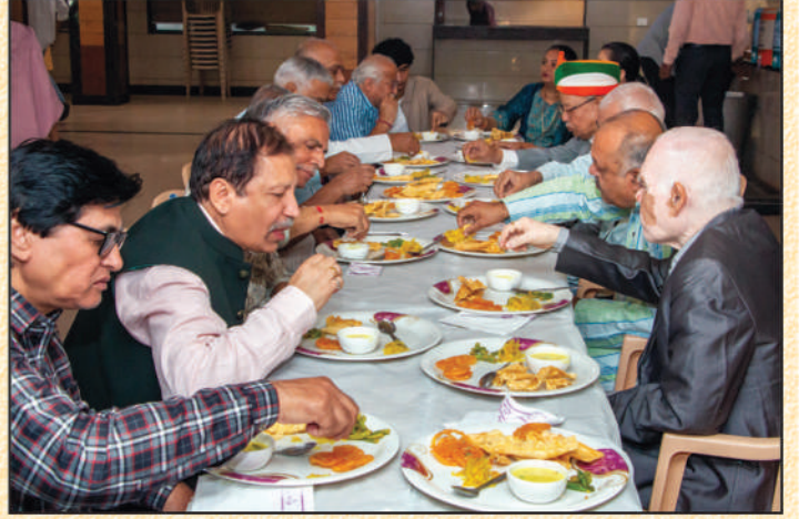
નાસ્તાની મોજ માણતા મહેમાનો અને સંસ્થાના હોદ્દાદારો