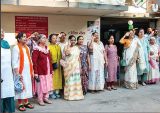
ધ્વજવંદન કરતાં સમાજના સભ્યશ્રીઓ