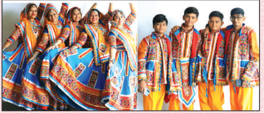
એક સ્ટેજમાં કલાકારો દ્વારા ફોટો સેશન