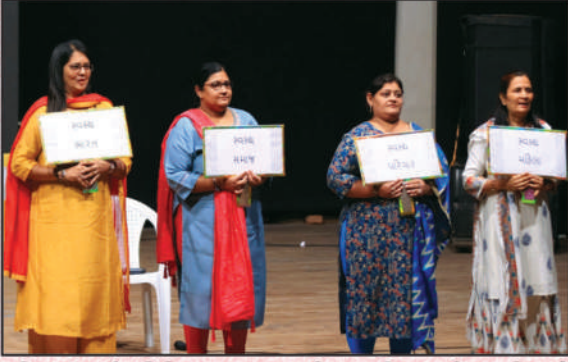
મહિલા ઉત્કર્ષ સમિતિ દ્વારા સ્વસ્થ મહિલા અભિયાનની જાગૃતિ માટે નાની સ્કીટનું પરફોર્મન્સ