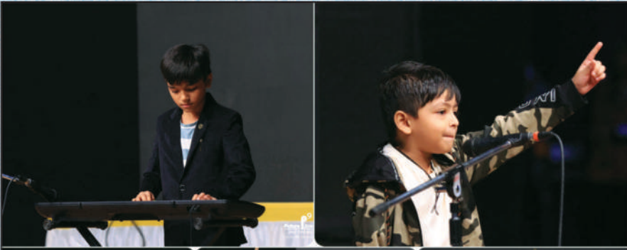
સાંસ્કૃતિક કાર્યક્રમ દરમિયાન જુદા જુદા બાળ કલાકારો દ્વારા વિવિધ પરફોર્મન્સ