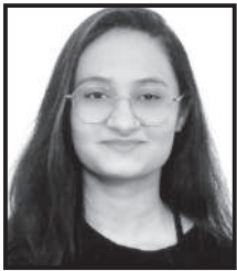
દેશના હેતલબેન-નીરલભાઈ શાહ Std.-12 (Arts) 87.8%