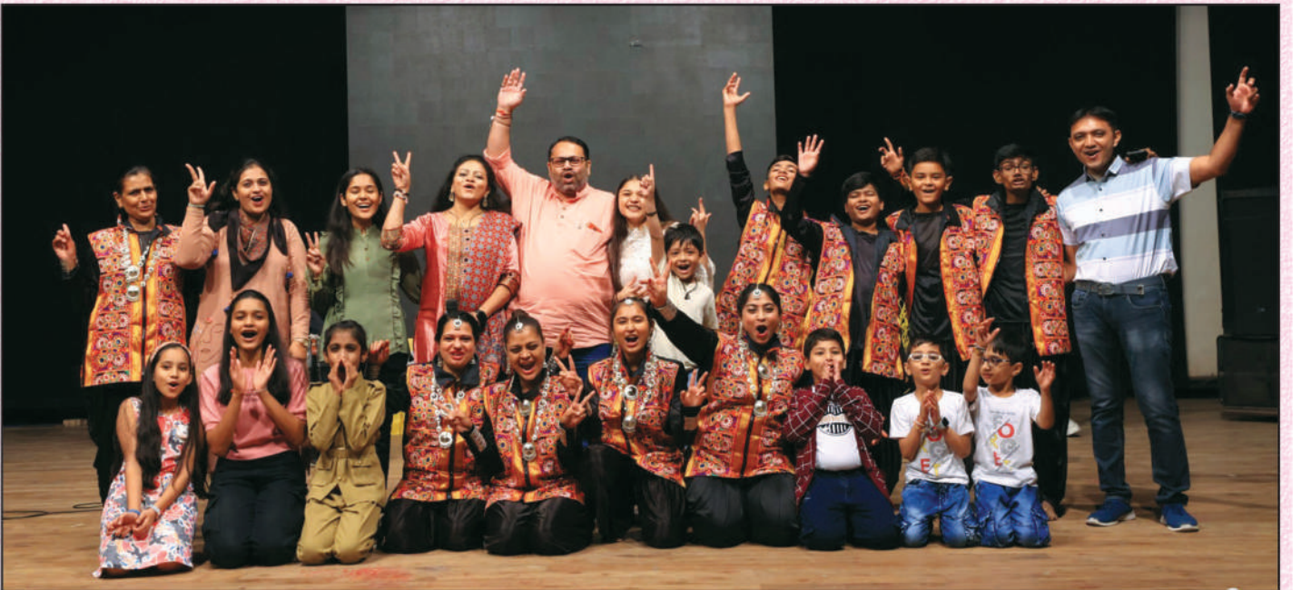
'ટેલેન્ટ શો'માં ઉલ્સાહભેર ભાગ લેનાર પાર્ટીસિપેન્ટ્સ અને સાંસ્કૃતિક સમિતિના સભ્યો