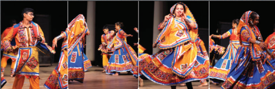
ટ્રેડિશનલ ગરબાથી સાંસ્કૃતિક કાર્યક્રમની શરૂઆત અને જુદુ જુદુ પરફોર્મન્સ આપતા સાંસ્કૃતિક સમિતિના કલાકારો