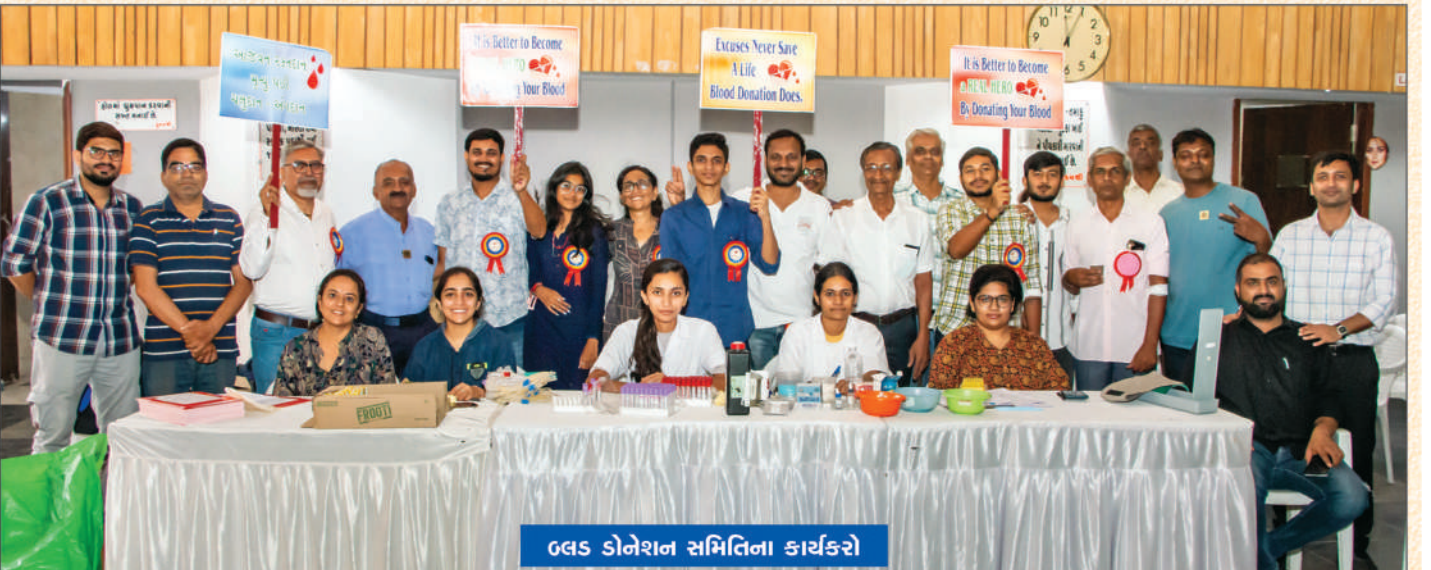
GLS ડોનેશન સમિતિના કાર્યકરો