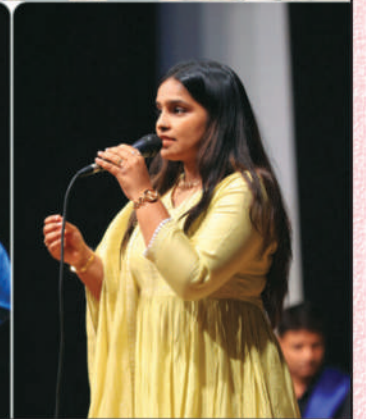
સમાજના જુદા જુદા કલાકારો દ્વારા ગીતોનું પરફોર્મન્સ