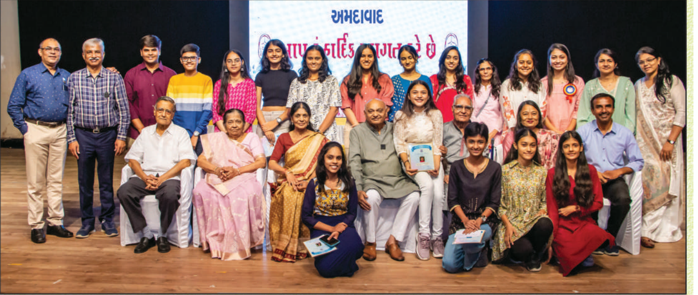
સરસ્વતી સન્માનના દાતાશ્રીઓ સાથે બહુમાન મેળવનાર તેજસ્વી વિદ્યાર્થીઓ