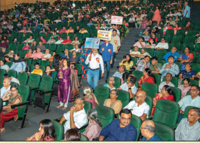
કાર્યક્રમ નિહાળતા સમાજના સભ્યશ્રીઓ